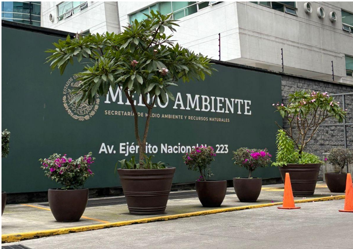
Figura 2. Oficinas generales de la SEMARNAT