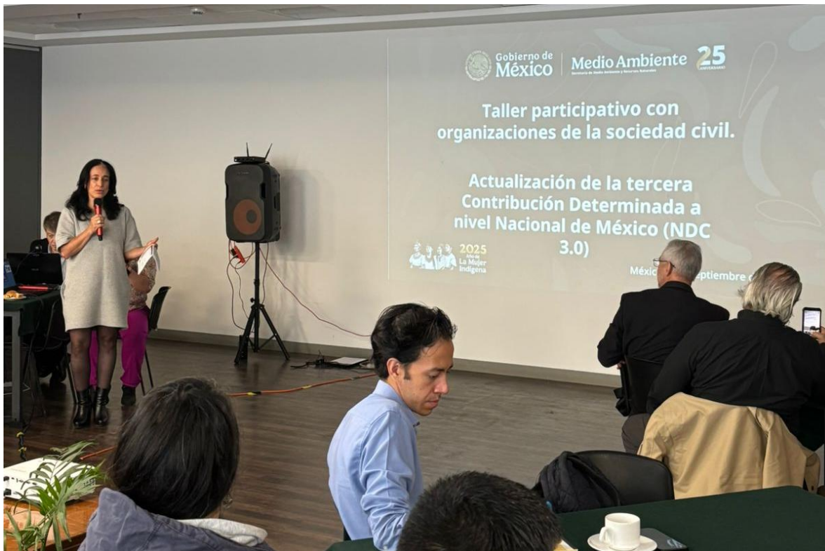
Figura 1. Taller participativo para la actualización de la NDC de México.

Motivados por nuestra contribución permanente, respondimos al primer llamado del “ Taller participativo con organizaciones de la sociedad civil para la actualización de la NDC de México ”, impartido por la Secretaría de Medio Ambiente y Recursos Naturales ( SEMARNAT ). Este diálogo busca identificar temas y oportunidades clave para implementar la nueva NDC, integrando las voces de las organizaciones que impulsan la acción climática en el país. Este evento invita a la sociedad civil a participar activamente en la NDC 3.0, por lo que presentamos este documento como aportación.